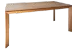
オーク材突板/ウレタン仕上げ