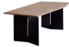
オーク材突板/ウレタン仕上げ+スチール(ブラック)