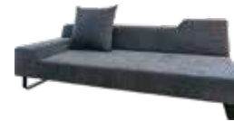
ファブリック(チャコールグレー)